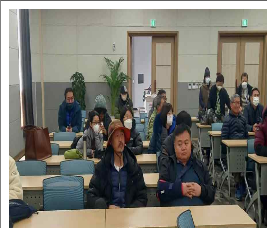
2월 25일 두루미 개체수 조사(교육)