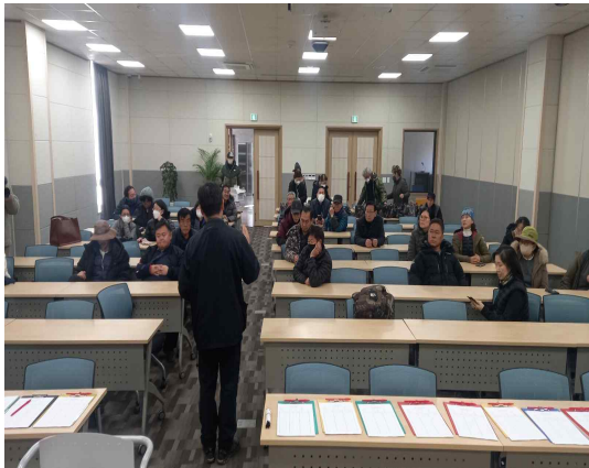
2월 25일 두루미 개체수 조사(교육)