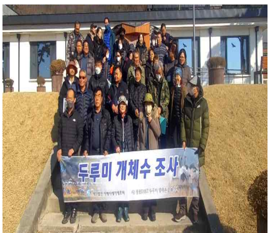
2월 25일 두루미 개체수 조사