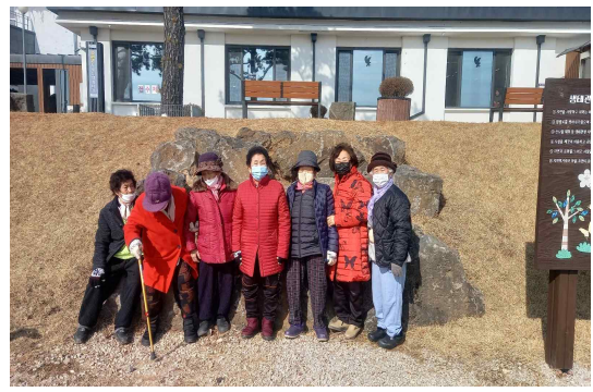
2월 9일 권순천외 16명