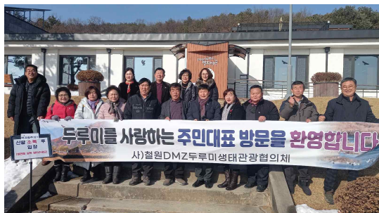
1월 18일 천경산외 16명