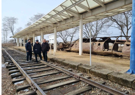
2월 11일 운영목외 3명