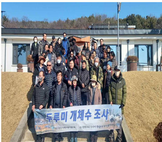
2월 25일 두루미 개체수 조사