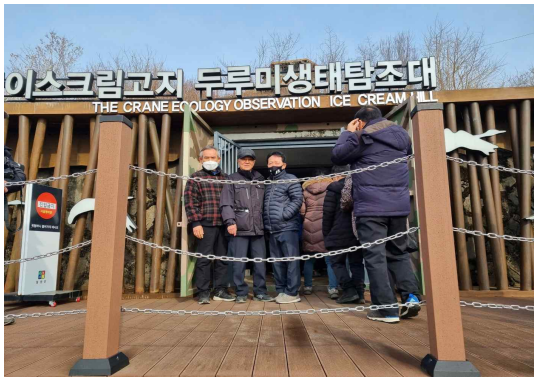
2월 11일 운영목외 3명