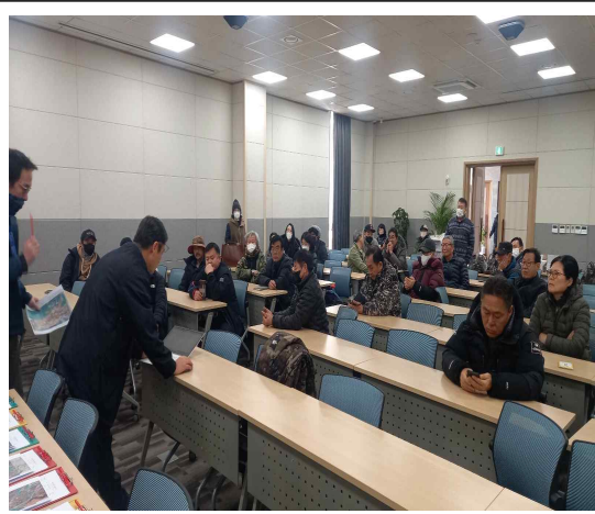
2월 25일 두루미 개체수 조사(교육)