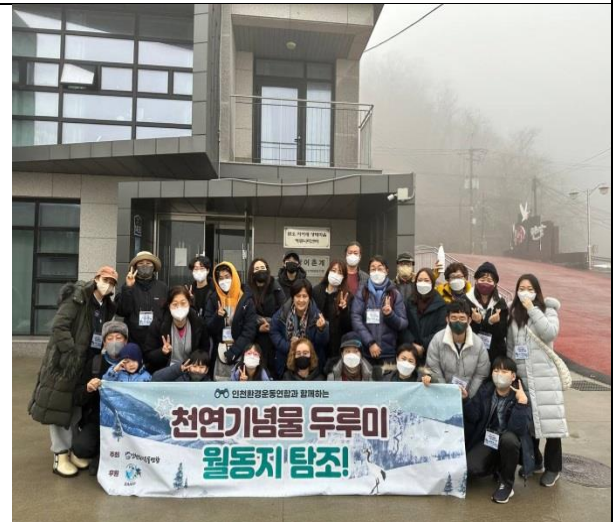
2023. 01. 13. 강화 두루미 탐조