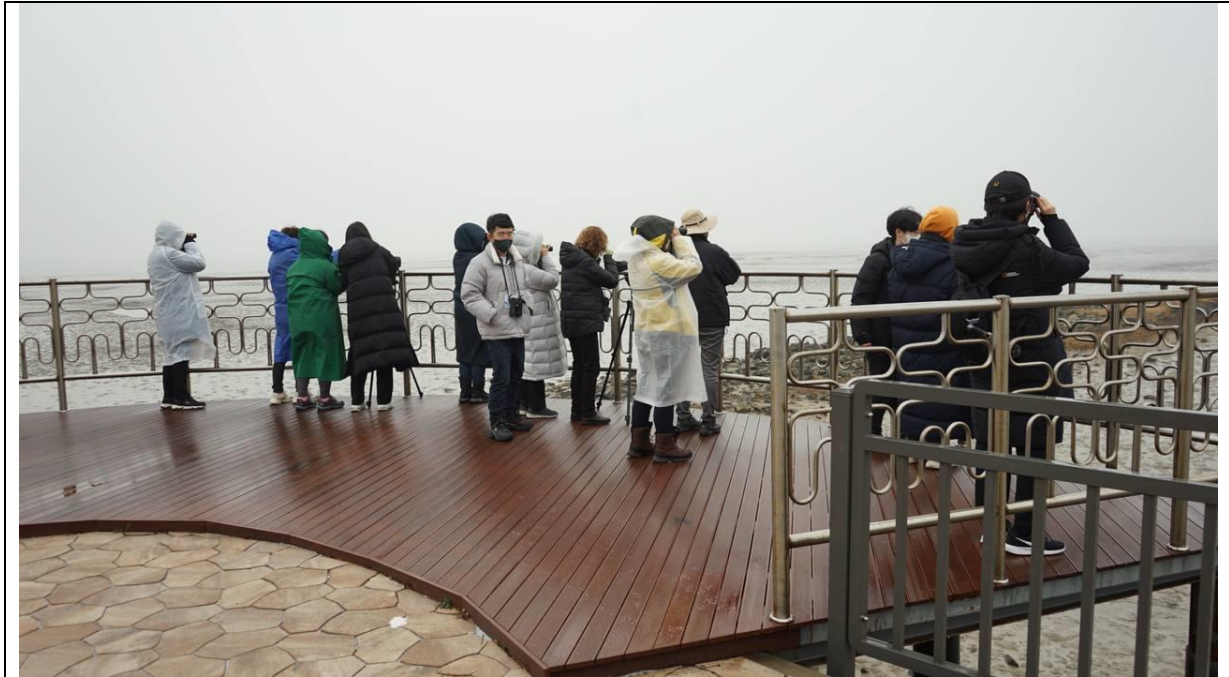
강화 동검도에서 두루미를 탐조하고 있는 참가자들