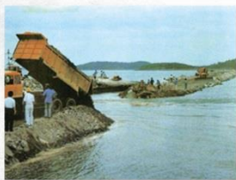
출처: 인천경제자유구역 블로그