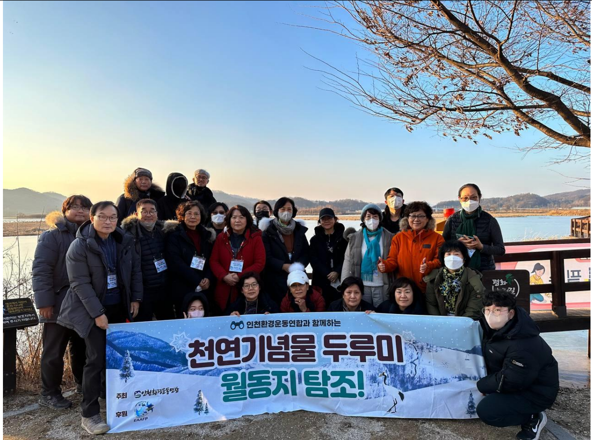
철원 학저수지에서 탐조 후 참가자들과 찍은 사진