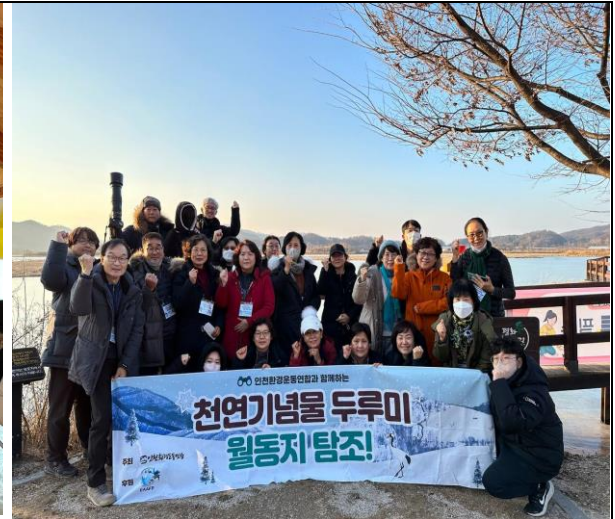
2022. 12. 09. 철원 두루미 탐조